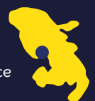
Fort de France